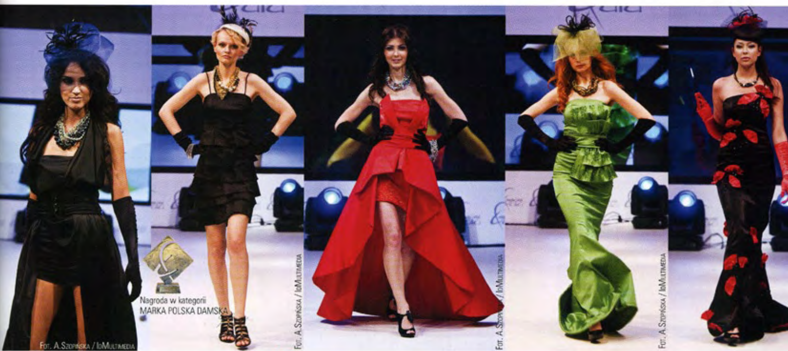
Nagroda w kategorii MARKA POLSKA DAMSKA