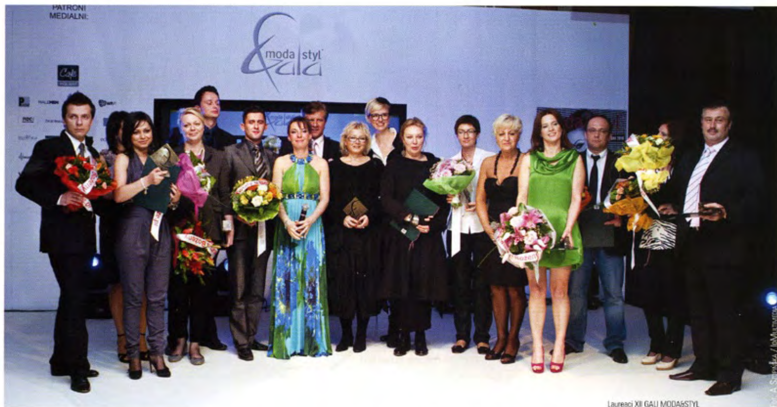
Laureaci XII GALI MODA&STYL