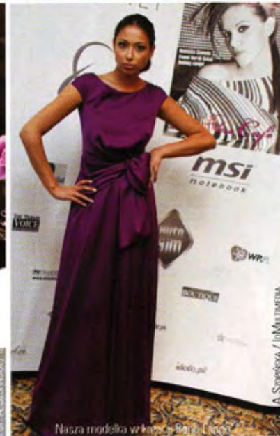
Nasza modelka w kreacji Rena Lange