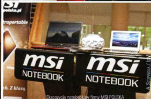
Ekspozycja notebooków firmy MSI POLSKA

Galę poprowadziła para Justyna Sieńczyłło i Zygmunt Chajzer. Jak zawsze pełna ciepła i uśmiechu aktorka wystąpiła w sukni przygotowanej przez markę Renato Nucci, a garnitur popularnego prezentera wykonała firma Lavard.